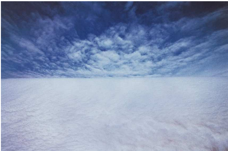
Appennino, 1977 © Franco FONTANA – Courtesy galerie baudoin lebon Paris