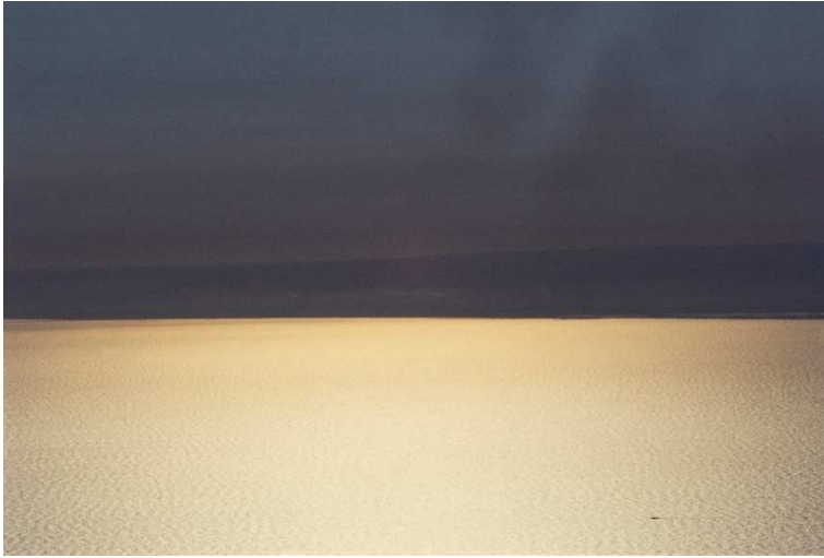
Adriatico, 1975

Franco FONTANA – Horizons 1 er juin – 30 septembre 2018 Musée de la Photographie Charles Nègre – Nice