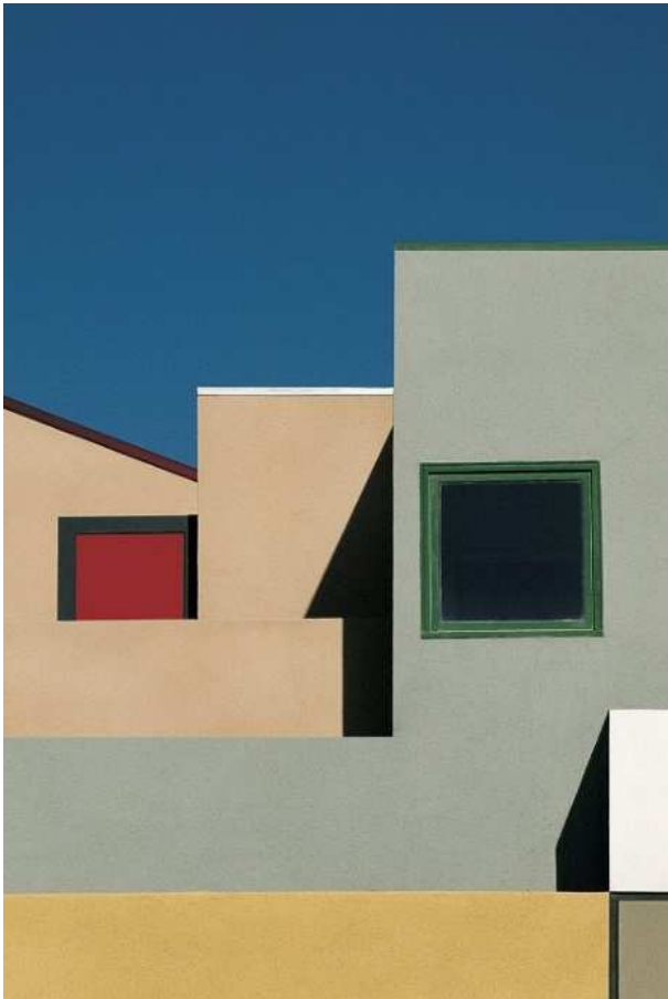
Paesaggio urbano, Venice, Los Angeles - 1990

Franco FONTANA – Horizons 1 er juin – 30 septembre 2018 Musée de la Photographie Charles Nègre – Nice