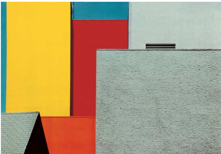
Paesaggio urbano, Los Angeles - 1991 © Franco FONTANA – Courtesy galerie baudoin lebon Paris