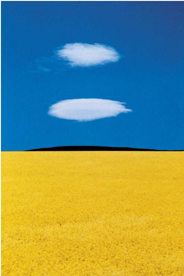
Puglia, 1978

Musée de la Photographie Charles Nègre – Nice