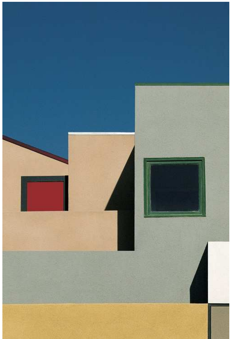
Paesaggio urbano, Venice, LA, 1990