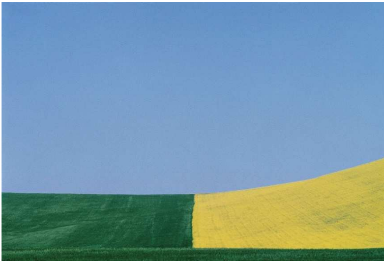
Lucania, 1975